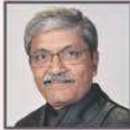
રૂપાંતર : ડૉ. વિશલ નાગડા