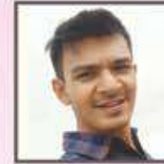
સંગીત : હાર્ટિક પાસડ