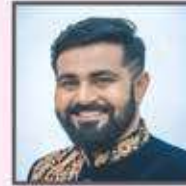
સહાયક દિગ્દર્શક/બેકડ્રાઉન્ડ સ્કોર : કવન સાવલા