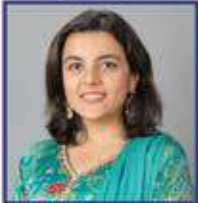
ધરા દિવ્યા જયેશ ૬૫૮૨ (ગેજાચોરા-મુલુંડ)