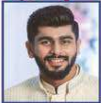
ભવ્ય રક્ષા અનિલ કેનીયા (નરોઈ-દાદર)