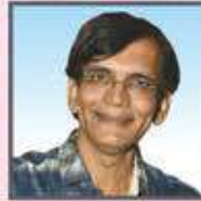
પુન:લેખન - દિગ્દર્શન : વસંત મારૂ